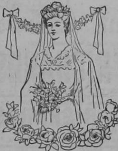
(Para las jóvenes débiles, nerviosas o demacradas.)