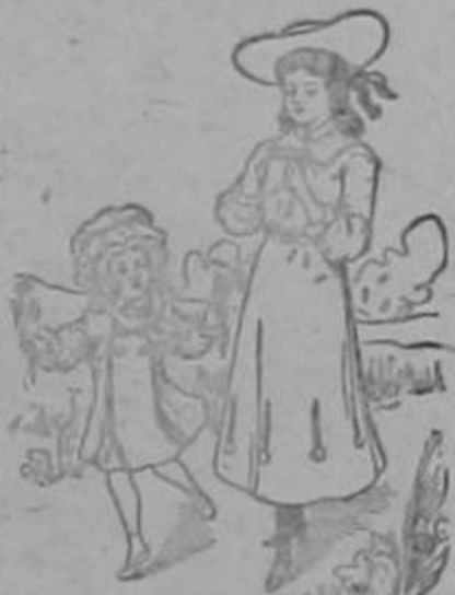
(Para las niñas q. comienzan a entrar en el estado de mujer)