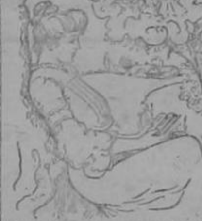
(Para la señora q. está entristecida porque le parecen imposible sus males.)

El Dr. H. R. Koen de la Facultad de Medicina de Paris, de Port-au-Prince, Rep. de Haití, CERTIFICA: "He prescrito a mis enfermas el Compuesto Mitchella habiendo obtenido admirables resultados en los siguientes casos: Para calmar los dolores frecuentes durante el embarazo y el parto, flores blancas, menstruación dolorosa y como tónico reconstituyente. Lo recomiendo a las señoras y señoritas q. sufren de iguales dolencias."