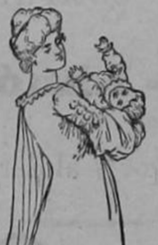
(Para la señora embarazada y para la madre q. está criando.)